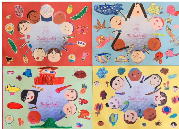
伊江村立伊江幼稚園 児童による合作 作品テーマ 『ダイキンオーキッドちゃんぷる～ ～沖縄は、おいしいもの、楽しい事、おもしろい事いっぱい～』