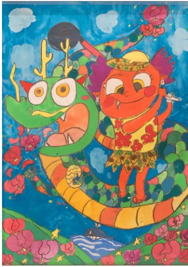
古堅 直太朗さんの作品 作品テーマ 『りゅうとキジムナーの最強タッグ』