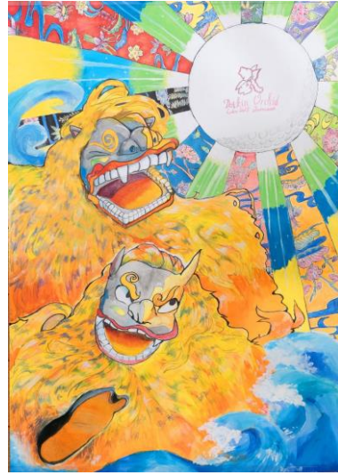
知念 杏祈さんの作品 作品テーマ 『湧き上がる沖縄ゴルフ魂』